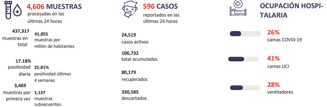
Figura 1. Tendencia de los casos y positividad de COVID-19 en República Dominicana al 17/09/2020