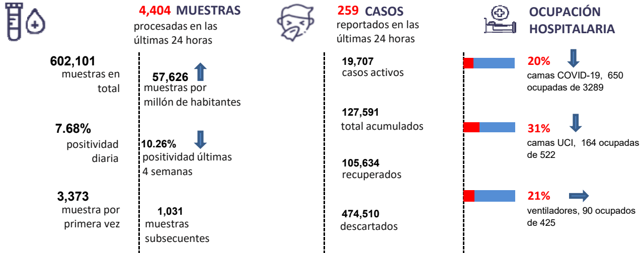
Figura 1. Tendencia de los casos y positividad de COVID-19 en República Dominicana al 01/11/2020