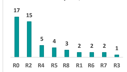
Gráfico 2: MpN según lugar de atención junio, 2023

Enriquillo 111%, R5 Este -42, R6 El Valle -50%, R7 Cibao Occidental -24% y R8 Cibao Central 14%, al comparar con el acumulado del mismo periodo del año anterior.