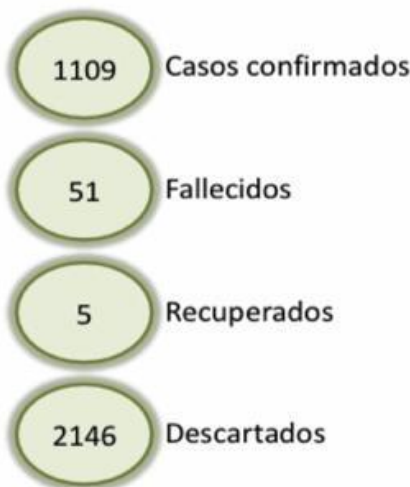
Figura 1. Casos confirmados de COVID-19 según fecha de confirmación. República Dominicana, 30/03/2020

Hasta la fecha, del total de casos sospechosos reportados al SINAVE, el 66% (2146/3255) fueron descartados por laboratorio. Otros 24 casos sospechosos están en espera de resultados.