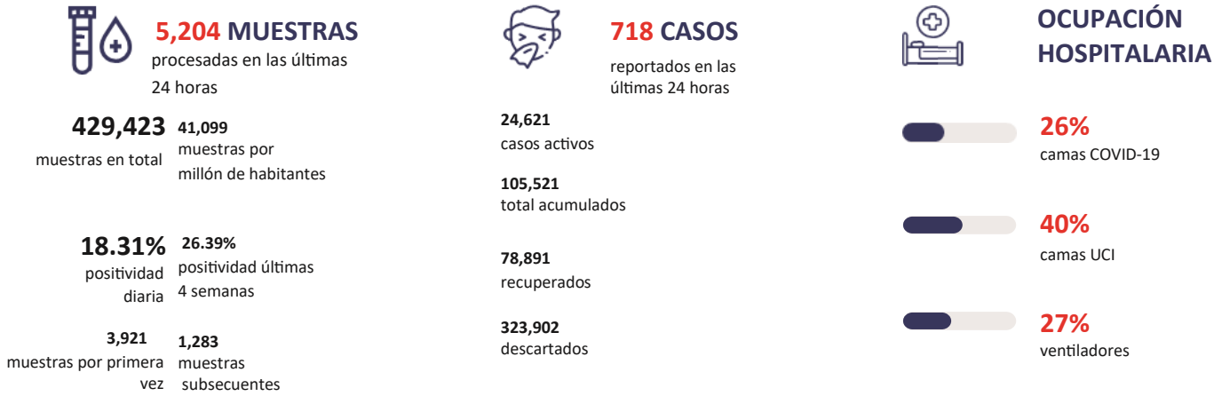
Figura 1. Tendencia de los casos y positividad de COVID-19 en República Dominicana al 15/09/2020