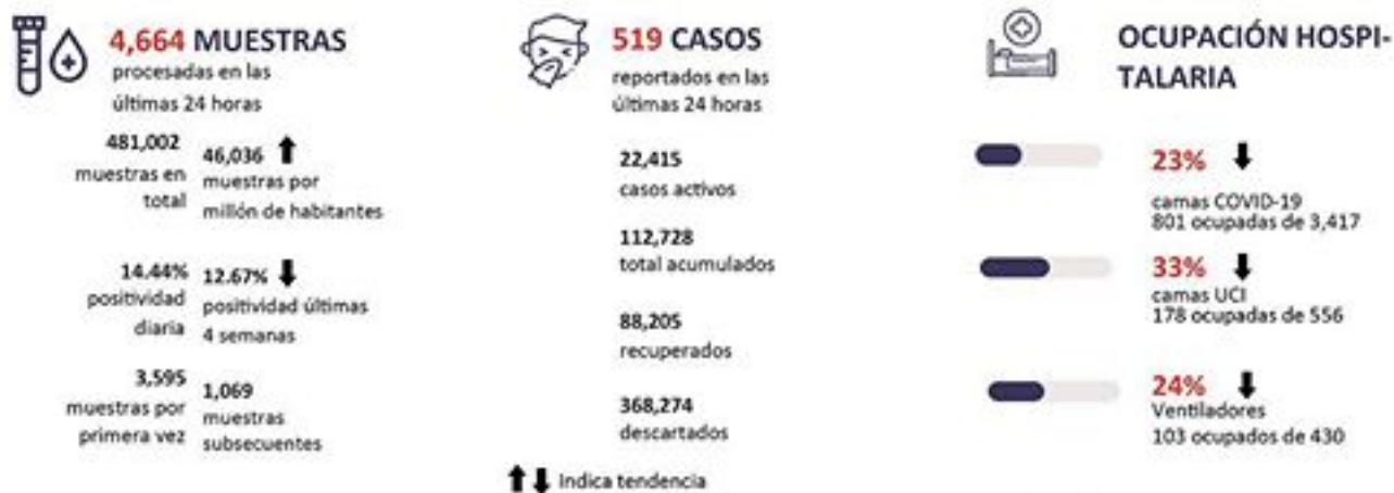
Figura 1. Tendencia de los casos y positividad de COVID-19 en República Dominicana al 30/09/2020