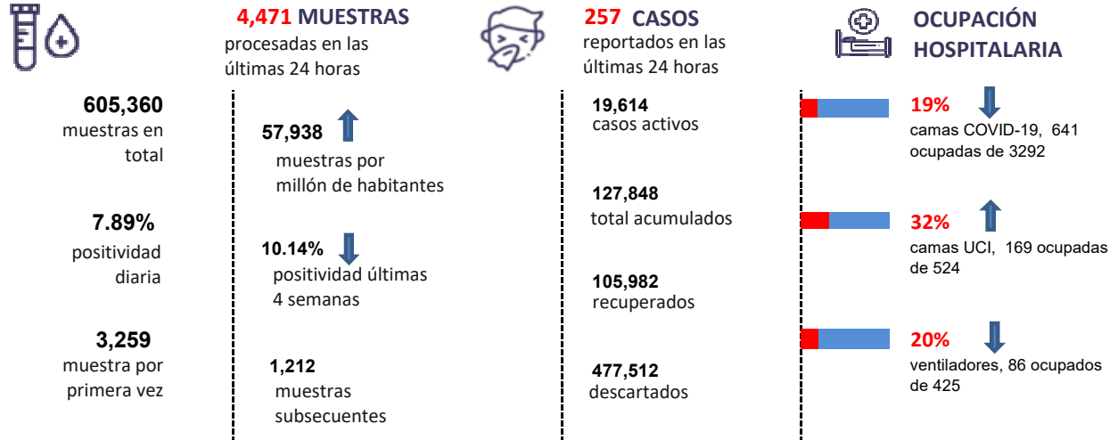
Figura 1. Tendencia de los casos y positividad de COVID-19 en República Dominicana al 02/11/2020