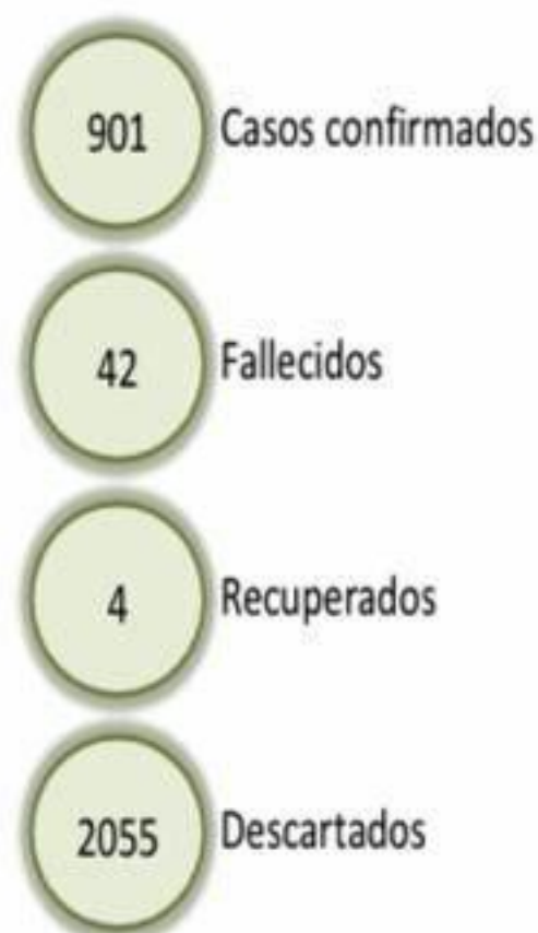
Figura 1. Casos sospechosos de COVID-19 según fecha de reporte y resultado de laboratorio. República Dominicana, 29/03/2020

En relación a los fallecimientos, la mediana de edad es de 60 años, el 76% (32/42) eran hombres. El 52% (22/42) de las defunciones corresponden a la provincia Duarte (Letalidad=24%).